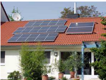
Residenziale: tetto a falda