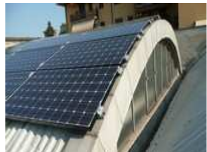
Produttivo: tetto a botte

CIRCOLO LEGAMBIENTE Onlus CHICO MENDES VIA TONALE, 16 SESTO SAN GIOVANNI